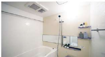
乾燥暖房機能付きシステムバス