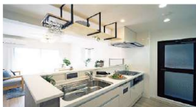
造作棚の付いたカウンタキッチン