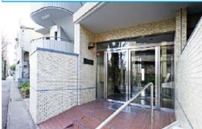
エントランス (オートロック)