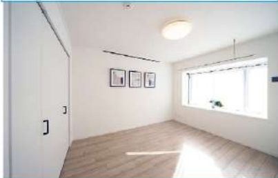
ピクチャーレール付きの洋室