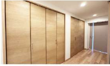
ホール、廊下に収納も豊富

※見えない給水給湯配管も新規交換済み! ※引渡し時新規鍵交換もサービス致します。