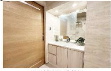
三面鏡の洗面化粧台