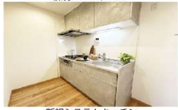
新規システムキッチン