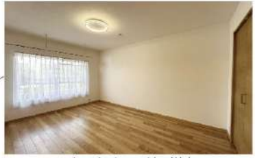
ホスクリーン付の洋室