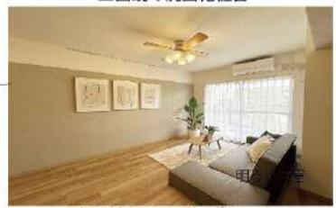
家具付きのリビングルーム