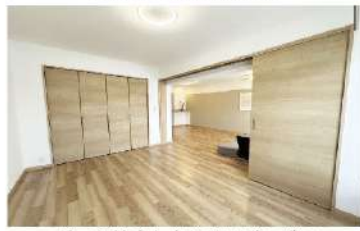
引戸を外すと広めのリビングに