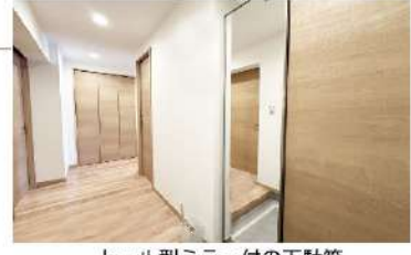
トール型ミラー付の下駄箱