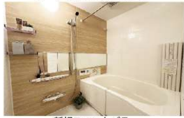
新規ユニットバス

※見えない給水給湯配管も新規交換済み! ※引渡し時新規鍵交換もサービス致します。