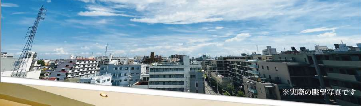
※実際の眺望写真です